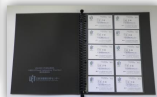
▲認定取得記念ノベルティー「カードホルダー」