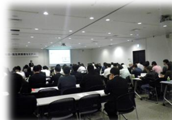
▲食品・衛生実務者セミナー