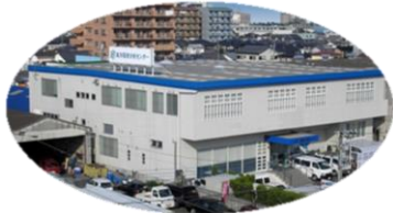
▲宮崎ラボラトリー

旧年中は格別の御厚情を賜り、厚く御礼を申し上げます。 本年も社員一同、皆様にご満足頂けるサービスを心がける所存でございます。何卒今後とも一層のご愛顧を賜りますよう、お願い申し上げます。皆様のご健勝と、貴社益々のご発展を心よりお祈り致します。