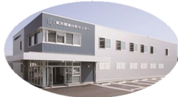
▲福岡ラボラトリー