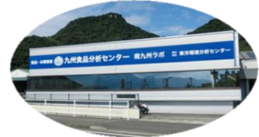
▲九州食品分析センター